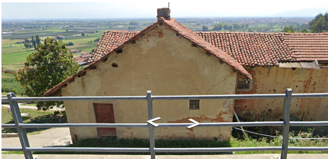
Immagini Google Street View