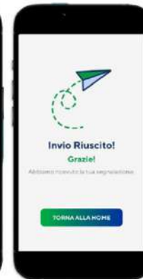
Step 5: feedback all'invio