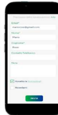
Step 4: dati segnalazione