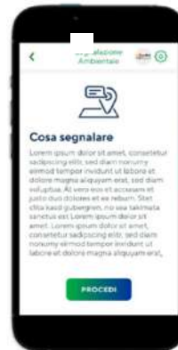
Step 1: scheda informativa generale del servizio

La segnalazione ambientale: i cittadini possono segnalare situazioni che necessitano di un intervento