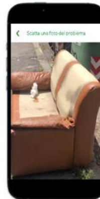
Step 3: foto della segnalazione e contestuale recupero delle coordinate geografiche