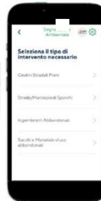
Step 2: scelta tipologia di segnalazione