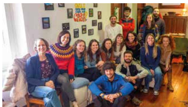
- Il gruppo del tavolo di lavoro Linea 91