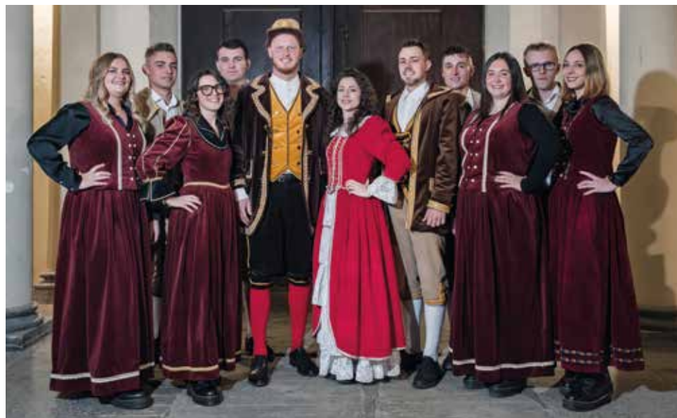
- Micon e Miconëtta con l'allegro gruppo di maschere

sostruttura coperta e riscaldata dell'Area Capannoni di corso Romita, con servizio bar e guardaroba. Si parte venerdì 23 gennaio con la Gran Cena di apertura dove avverrà la consegna delle chiavi della città a Micon e Miconëtta, seguita dalla prima festa in maschera. Sabato 24 gennaio spazio ai più piccoli con il Carnevale dei Bambini con merenda offerta da panificatori e pasticceri buschesi e in serata ancora musica e divertimento. Giornata clou domenica 25 gennaio con la Gran Sfilata dei carri allegorici per le vie cittadine e a seguire Gran Polentata preparata dagli alpini. Il programma proseguirà nelle settimane successive con la tradizionale visita delle maschere nelle scuole e nelle strutture assistenziali cittadine e, il 16 e 17 febbraio al Cinema Teatro Lux, con la commedia in piemontese della compagnia "Èl Cioché".