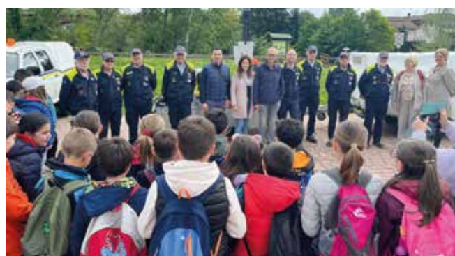
- I bambini a scuola di volontariato

Da quest'anno il Comune aderisce al progetto SAI - Servizio di Accoglienza e Integrazione, coordinato dal Comune di Cuneo, promosso dal Ministero dell'Interno e ANCI - Associazione Nazionale Comuni Italiani, per favorire l'autonomia e l'inclusione dei titolari di protezione internazionale. Dal mese di luglio, Busca accoglie una famiglia ucraina di sette persone tra adulti e minori, seguita dalla Cooperativa Insieme a Voi.