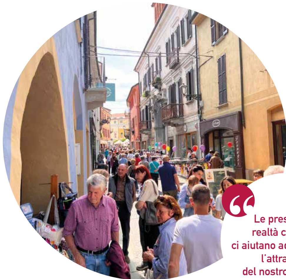
- Via Umberto I durante la Fiera di Maggio