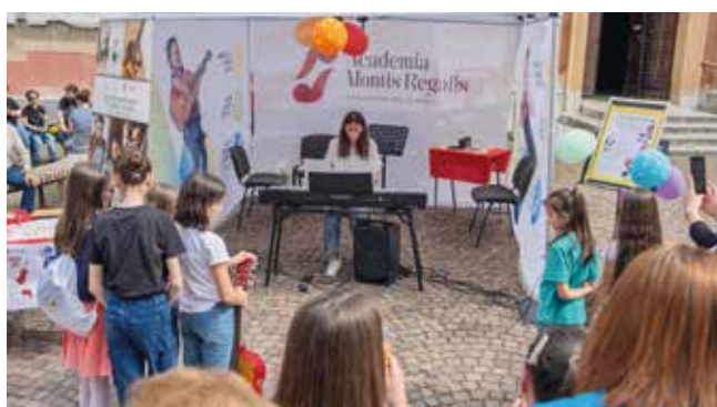
- Lo stand dell'Istituto Musicale alla Fiera di Maggio