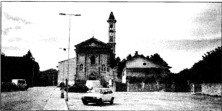
S. Chiaffredo, prima frazione di Busca, avrà una notevole espansione

Lo sforzo tecnico e programmatico dell'Amministrazione Comunale si orienta davvero verso obiettivi precisi e importanti per la Città. Busca in questi anni è cresciuta, lo sviluppo non si è fermato: vivacità e coraggio imprenditoriale da una parte, qualità della vita dall'altra concorrono a far sì che la cittadina sia scelta da un numero crescente di persone. Busca è prossima al raggiungimento dei diecimila abitanti: per questa e per altre sfide, l'impegno dell'Amministrazione Comunale è rivolto all'interesse e al benessere dell'intera comunità.