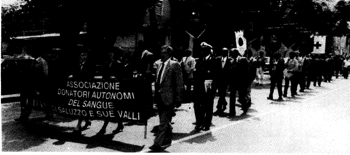
La festa per il ventennale del Gruppo Adas Busca nel 1989

Nel 1990 nelle donazioni fatte a Busca sono stati prelevati 88.000 centimetri cubi di sangue intero.