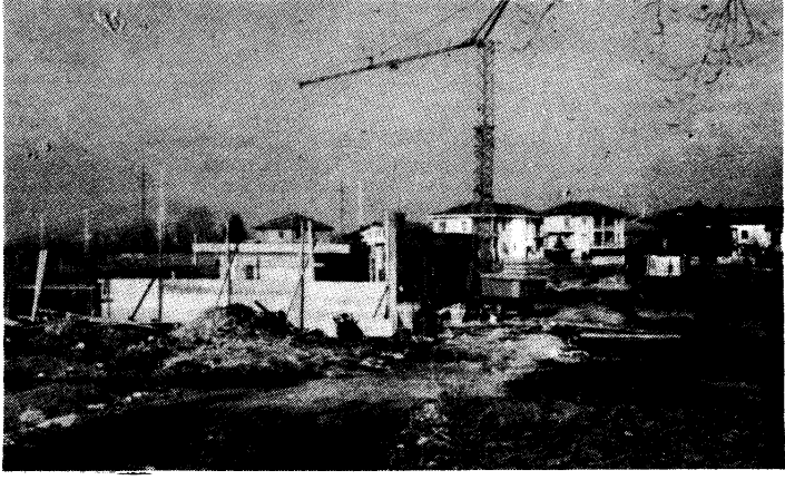
In costruzione nuovo pozzo e impianti di potabilizzazione per l'acquedotto.