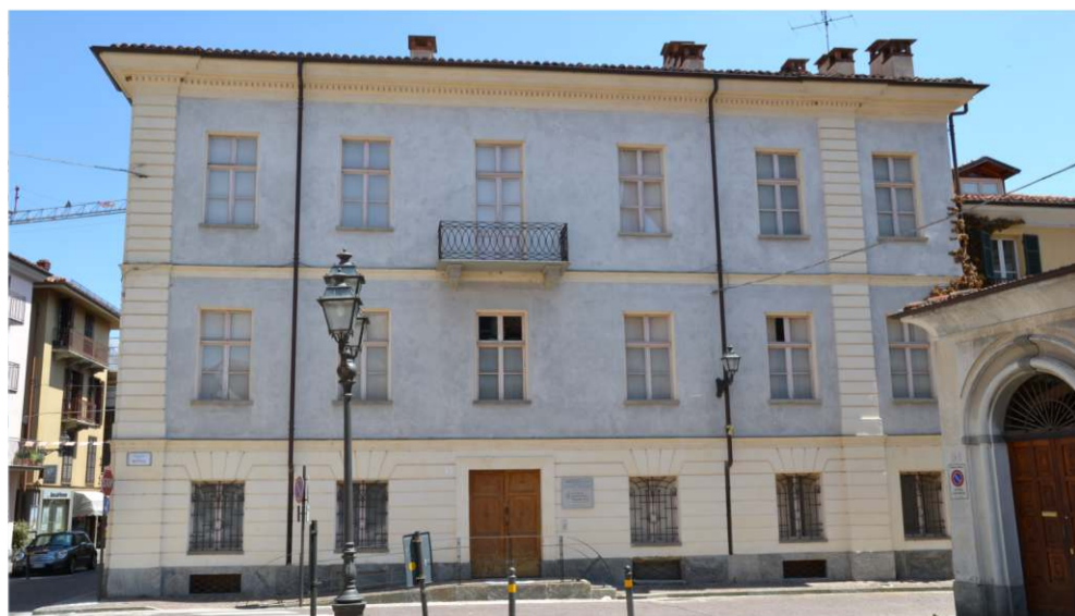
La sede dell'Istituzione comunale culturale e del civico istituto musicale Vivaldi, in piazza della Rossa

Info: piazza della Rossa 1 - Tel. 0171.946528; istitutoculturale-b@libero.it