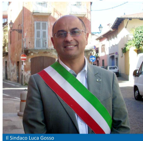
Il Sindaco Luca Gosso

completati dalla prossima amministrazione, come quello del nuovo polo sanitario e assistenziale. E abbiamo avviato la collaborazione con i privati, come per la realizzazione della nuova rete di teleriscaldamento, che pone Busca tra le prime città in provincia con questo servizio. Consegniamo, poi, un aggiornato progetto urbanistico, moderno e funzionale. Abbiamo cercato con varie iniziative, come la Città europea dello Sport e la rievocazione storica dei 250 anni dal titolo di Città, di favorire il senso di appartenenza alla comunità e valorizzare il mondo associativo, che è ricco e in fermento. Lasciamo in perfetto ordine i conti del Comune. Rispetto al 2004 abbiamo più che dimezzato il debito, la spesa corrente è la più