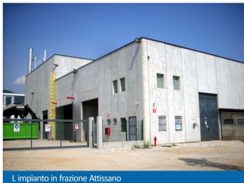
L'impianto in frazione Attissano

Ma il Comune ha ottenuto anche condizioni in convenzione tali da apportare significativi risparmi economici, con annesse importanti migliorie alla viabilità.