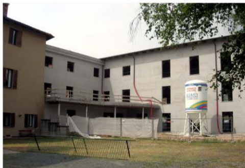
Di nuovo al lavoro nel cantiere della nuova ala della casa di riposo

Il sindaco ha spiegato che, dopo la concessione in comodato della nuova ala in costruzione dal Comune all'Ospedale, ratificata nel febbraio 2012, il progetto è stato ripensato in base alla nuova situazione ed alle odierne esigenze dei buschesi. I tecnici del Comune e dell'Asl si sono confrontati assiduamente per ottenere un progetto immediatamente eseguibile, passando al vaglio tutti i dettagli e le imposizioni di legge. Circa 600 metri quadrati dei 1800 disponibili saranno utilizzati al piano terra ed al primo piano per il poliambulatorio. Il resto rimane a disposizione della casa di riposo, che avrà un