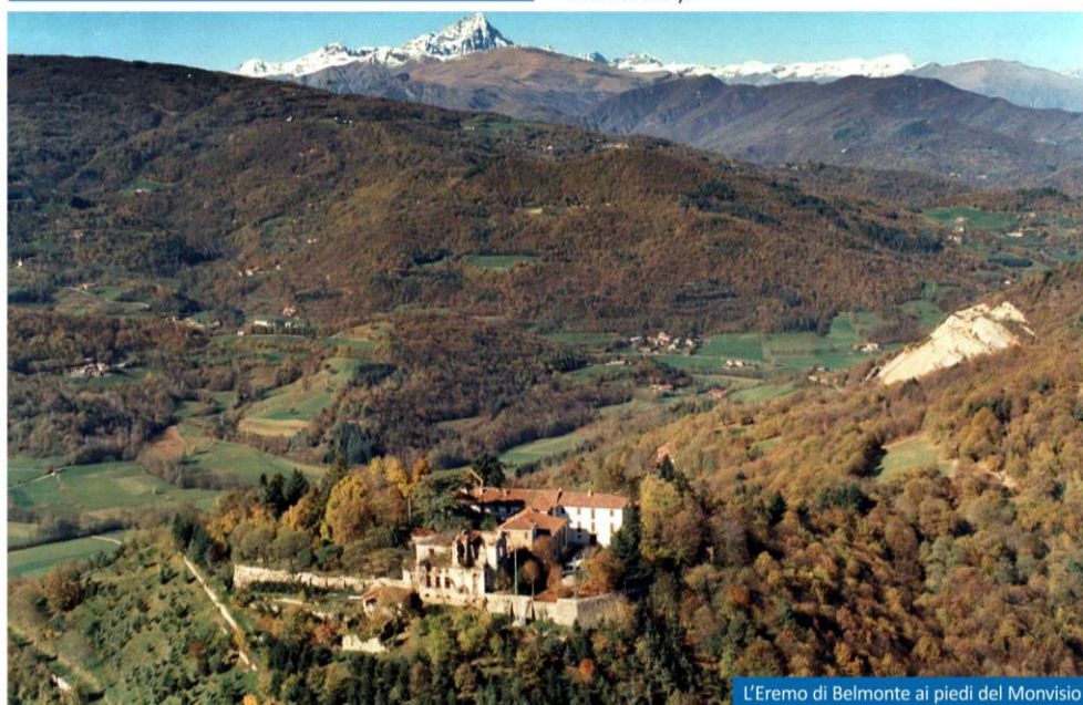
L'Eremo di Belmonte ai piedi del Monviso

I Grimaldi - Il ramo dei Grimaldi del Poggetto, derivato dai signori di Antibes, che fa parte della casata di Montecarlo, alla fine del '400 si stabilì a Busca, dove restò per quasi cinque secoli. Sotto Napoleone, Luigi Grimaldi del Poggetto (1790-1820) servì nella Campagna di Russia. Filippo (1767-1817) fu sindaco di Torino (1797) e di Busca (1799) e si dedicò all'educazione del futuro Re Carlo Alberto (1798-1849). I Grimaldi acquisirono l'Eremo nell'epoca napoleonica. Stanislao Grimaldi del Poggetto (1825-1903), che affidò al Gonin i dipinti in alcune sale, fu uno straordinario e poliedrico personaggio sia dal punto di vista militare sia artistico. Realizzò il monumento equestre dedicato al generale La Marmora attualmente situato a Torino. Numerosi componenti della famiglia sono stati anche amministratori comunali e fra i sindaci della città dal 1762 ad oggi il cognome Grimaldi è quello maggiormente citato.