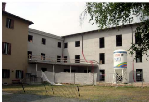
I mini alloggi per anziani saranno sistemati al secondo piano. Al piano terreno ed al primo piano ci saranno la palestra riabilitativa con gli ambulatori dell'Asl ed un salone riservato alla casa di riposo.

Comune e Ospedale, con la regia dell'Asl, concretizzano il progetto di ricollocazione delle strutture sanitarie e assistenziali della città, riavviando il cantiere che darà un nuovo volto funzionale, urbanistico e sociale alla comunità locale.