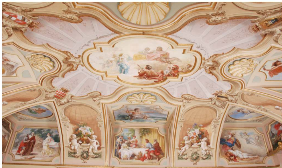
L'Eremo ospita affreschi di Francesco Gonin (1880), recentemente restaurati. Nel refettorio, con gli stemmi dei casati, è rappresentata la leggenda di Telemaco, figlio di Ulisse, e nella Galleria dei quadri le Battaglie del Risorgimento

Spettacoli, concerti e una mostra dell'artista ottocentesco Stanislao del Poggetto