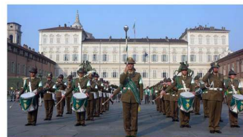
Un attaccamento speciale agli Alpini. E' questo sentimento diffuso che la Città vuole esprimere con affetto sincero con il conferimento della cittadinanza onoraria alla Brigata Alpina Taurinense. Nella foto la Fanfara Taurinense davanti a Palazzo Reale a Torino