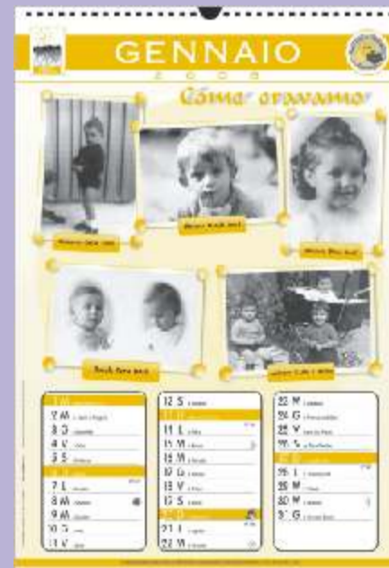
Foto di bimbi di una volta: dal 1800 in avanti, testimoni dei cambiamenti delle abitudini di vita e di costume avvenute negli anni sono le protagoniste del calendario 2008 realizzato dall'associazione 'I Volontari dell'Annunziata'.