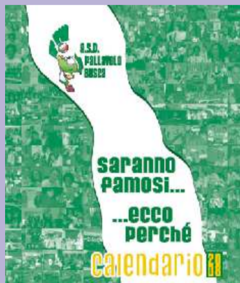
La Pallavolo Busca ha realizzato un calendario con i giocatori della 'prima' ritratti a casa degli sponsor.