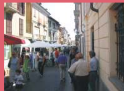
Busca in piazza pag. 3