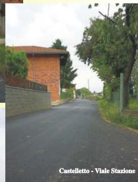
Castelletto - Viale Stazione