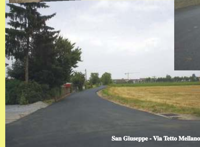
San Giuseppe - Via Tetto Mellano

L'impegno dell'amministrazione comunale nel settore della viabilità si sta concretizzando in queste settimane.