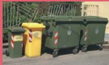
Speciale rifiuti pag. 6