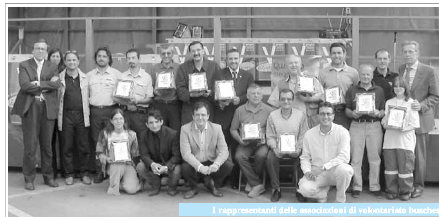
I rappresentanti delle associazioni di volontariato buschesi