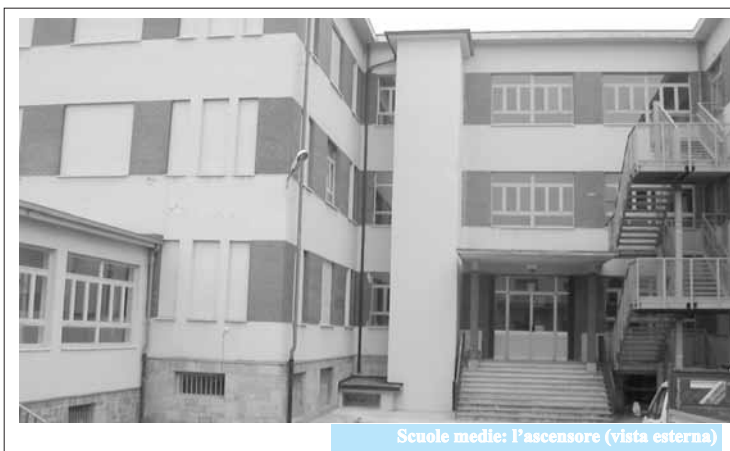
Scuole medie: l'ascensore (vista esterna)

Notiziario del Comune di Busca - Direttore: Luca Gosso - Direttore responsabile: Flavio Peano - Autorizzazione del Tribunale di Cuneo N° 393 del 28.09.1987 - Realizzazione e redazione: Publidok Via Laghi di Avigliana, 8 - San Chiaffredo - 12022 Busca (CN) - Stampa: L.C.L. Fr. Roata raffo, 63 - Busca. Anno XIX - N. 3 - Agosto 2005