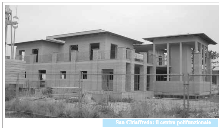
San Chiaffredo: Il centro polifunzionale

Stanno proseguendo con regolarità i lavori del cantiere Centro polifunzionale San Chiaffredo realizzato al cinquanta per cento dal