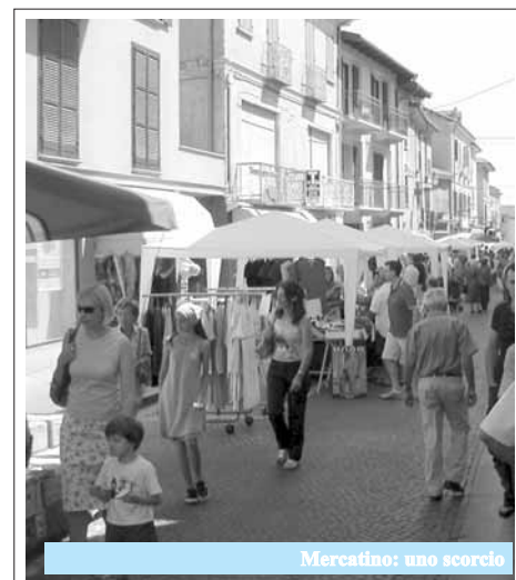
Mercatino: uno scorcio

Ci auguriamo che la festa della Madonnina (vedi programma a lato) confermi il successo e ripaghi tutti coloro che, con gran entusiasmo, credono e lavorano per far crescere Busca dal punto di vista turistico.